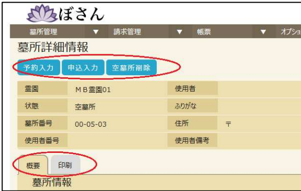
図 3. 空墓所の墓所詳細情報

霊園管理事務所は高齢の事務員が多いため、直感的に操作でき、操作ミスを減らすよう、システム上で工夫をしている。