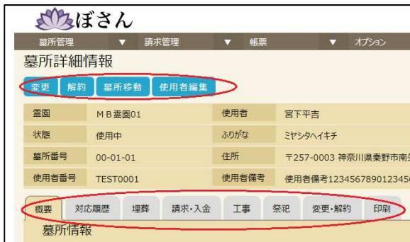
図 4. 使用中の墓所詳細情報

例えば現在の登録状況に応じた入力ができるように設計されており、墓所の状態が空墓所の場合は予約入力、申込入力などの新規契約に関する機能が利用できる。また、空墓所の削除が可能となっている。タブは概要と印刷しか表示されない(図3)。